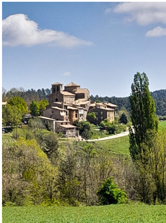
Sant Jaume de Frontanyà