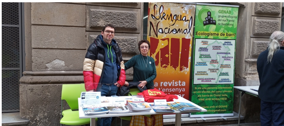
Inauguració local del carrer Rec