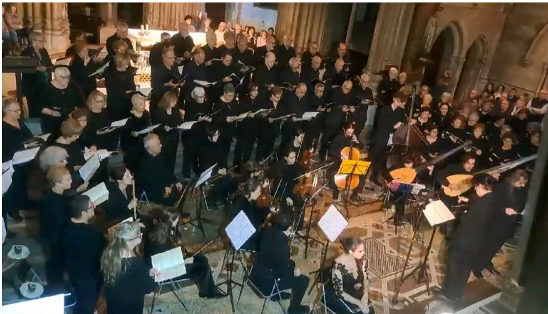
Santa Maria del Mar