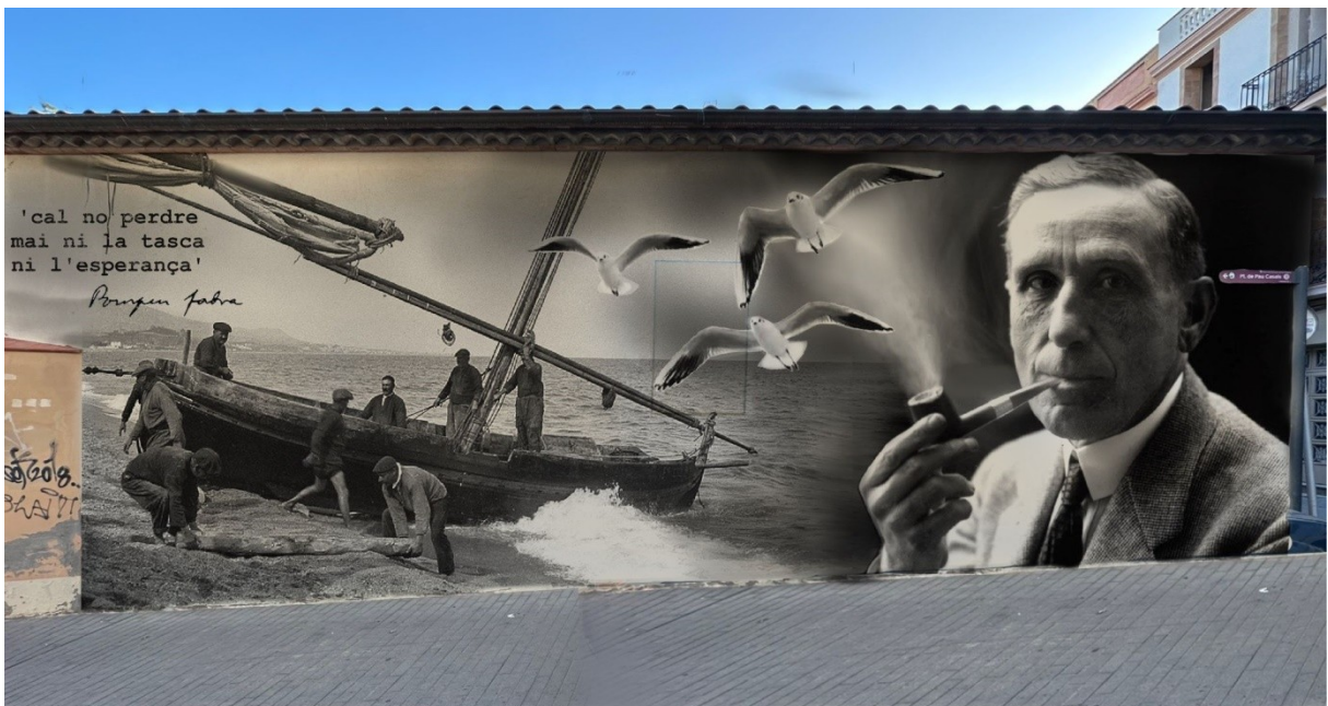
Projecte de mural a Can Casas