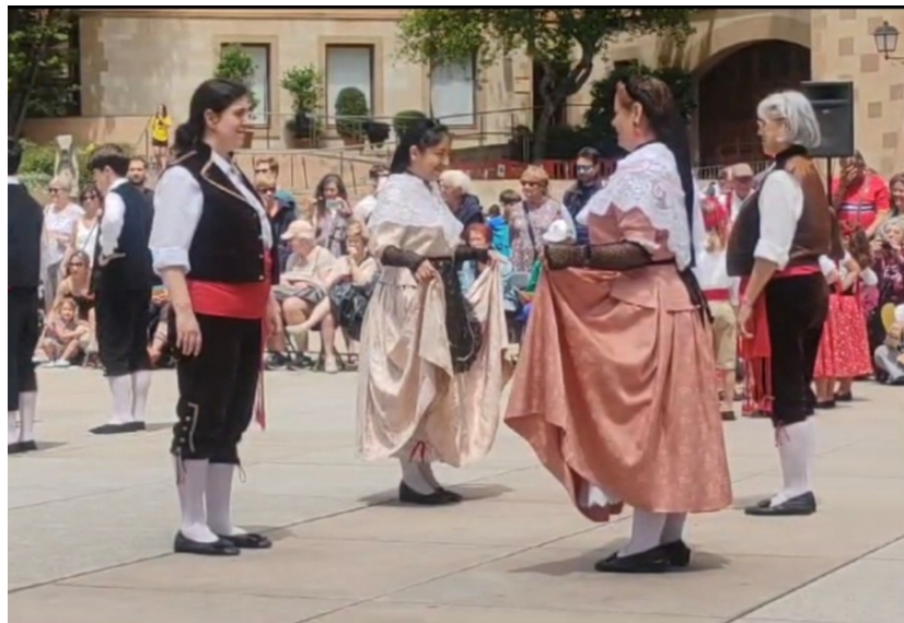
Cos de dansa