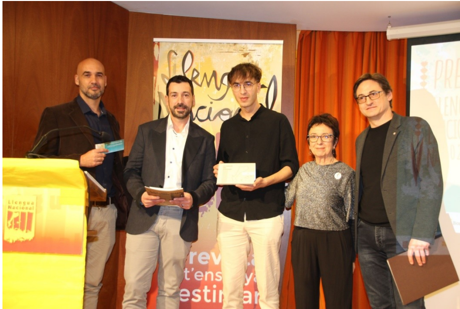
Premi Llengua Nacional